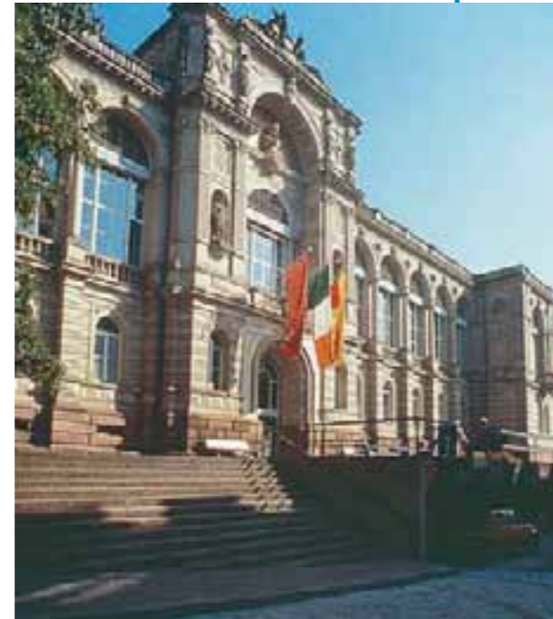
Das Friedrichsbad wurde 1877 eröffnet

Das Friedrichsbad steht genau an der Stelle, wo vor über 2000 Jahren die Römer ihre Bäder betrieben. Das palastähnliche Gebäude aus rotem und weißem Sandstein schmiegt sich ideal in den steilen Hang. Der Bau wirkt mit seiner reich verzierten Fassa-