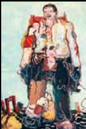
Heldenbild aus den 60er-Jahren von Georg Baselitz