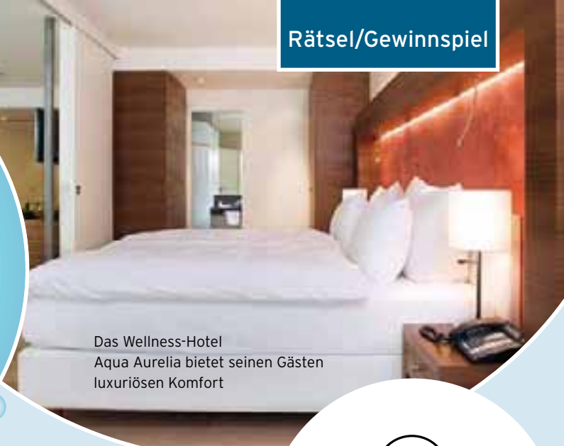
Das Wellness-Hotel Aqua Aurelia bietet seinen Gästen luxuriösen Komfort

Eintritt in die Caracalla Therme (4 Stunden) inkl. Tageseintritt ArenaVita Fitnesswelt