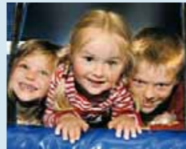
Kleine Gäste ganz groß: beim Familientag

Am Samstag, 7. November 2009, kommen Kinder ganz auf ihre Kosten. An diesem Tag steigt bei den Römischen Baderuinen ab 14 Uhr der Familientag. Nur so viel sei bereits verraten: Zahlreiche Aktionen garantieren Spaß, Abenteuer und gute Unterhaltung - übrigens auch für die großen Gäste.