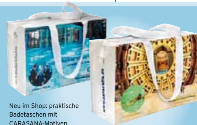
Neu im Shop: praktische Badetaschen mit CARASANA-Motiven

hergestellt. Das Besondere: Die Seife für den Caracalla Shop wird mit dem Baden-Badener Thermalwasser hergestellt. Der hohe Ölgehalt lässt die Haut nicht austrocknen. Weitere Infos unter der Telefonnummer: 072 21/27 59 69. ●