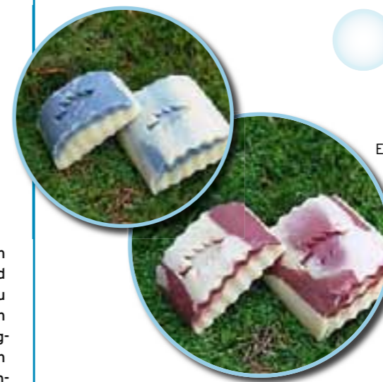
Ein duftendes Stück Schwarzwald: die Seifen „Veilchen-traum“ (l.) und „Schwarzwälder Kirsch“

racalla Therme Preisnachlässe zwischen 13 und 17 Prozent. Mit der VIP-Card brauchen Sie auch nicht an der Kasse zu warten, denn es gibt einen speziellen VIP-Eingang. Die VIP-Card ist übertragbar und kann von mehreren Personen genutzt werden. Ein weiteres Bonbon: Als Stammgast erhalten Sie das CARASANA-Magazin vor dem offiziellen Erscheinungstermin per Post nach Haus, kostenlos natürlich. Außerdem informieren wir Sie immer aktuell über Events und Veranstaltungen. Das Chip-Kartensystem ist übrigens im Juni in der gesamten Caracalla Therme eingeführt worden. Das heißt: Sie können sich überall bargeldlos bewegen. Sie bezahlen ganz bequem am Ausgang. ●