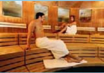
Schwitzen Sie sich gesund in der Caracalla Sauna-Welt

Das Schwitzen in wohliger Wärme kannten bereits unsere Vorfahren – die Steinzeit-Menschen. Die Rede ist von der Sauna! Wer regelmäßig ins Schwitzbad geht, stärkt nachweislich sein Immunsystem. Mediziner empfehlen ein bis zwei Saunabesuche die Woche. Der Effekt ist spürbar: Saunagänger werden seltener krank als Saunamuffel und sie erholen sich zudem schneller von Infekten. In der Caracalla Therme locken vielseitige Sauna-Angebote: In den acht verschiedenen Saunen finden Sie bestimmt Ihr individuelles Wohlfühl-Klima! ●