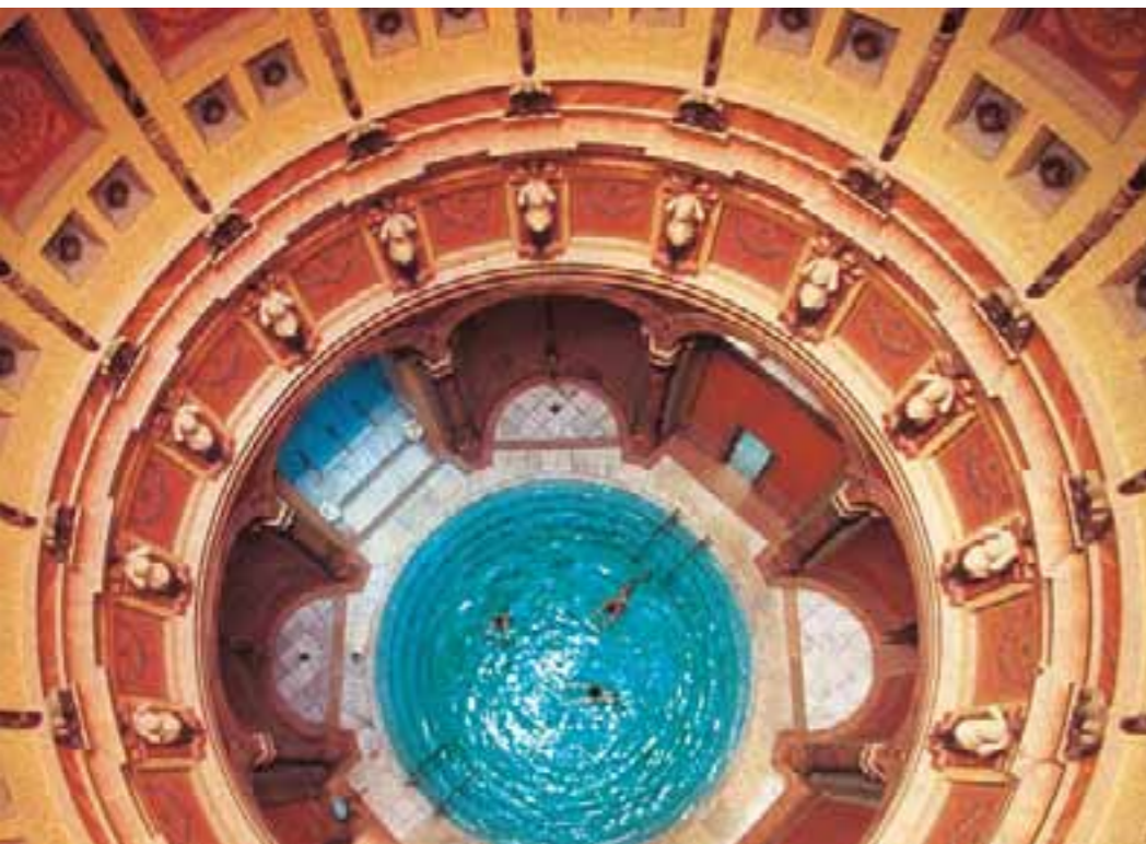
Grüße aus der Ewigen Stadt: Der Kuppelbau im Friedrichsbad vereint Elemente sowohl aus dem Petersdom sowie dem Pantheon in Rom